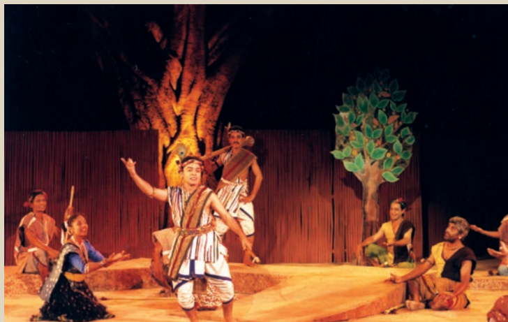
रामायण कथा का नाट्य रूपांतरण

दृश्य निर्धारित करने के बाद दृश्यों और मूल कहानी को पढ़ने से यह अनुमान लग सकता है कि मूल कहानी में ऐसा क्या है जो दृश्यों में नहीं आया है। लेखक द्वारा परिवेश का विवरण या परिस्थितियों पर टिप्पणियाँ प्रायः दृश्यों में नहीं ढल पातीं। यह देखना आवश्यक