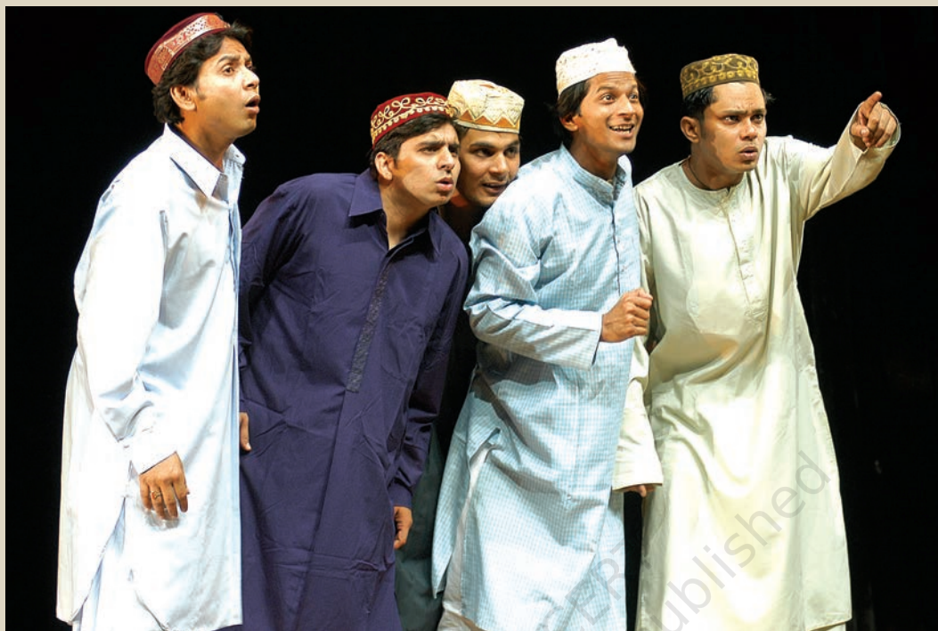
ईदगाह के नाट्य रूपांतरण का एक दृश्य

है। इसके लिए हमें नाटक की विशेषताओं को समझना होगा। जहाँ कहानी का संबंध लेखक और पाठक से जुड़ता है वहीं नाटक लेखक, निर्देशक, पात्र, दर्शक, श्रोता एवं अन्य लोगों को एक-दूसरे से जोड़ता है। चूँकि दृश्य का स्मृतियों से गहरा संबंध होता है इसलिए नाटक एवं फ़िल्म को लोग देर तक याद रखते हैं। यही कारण है कि गोदान , देवदास , उसने कहा था , सद्गति आदि के नाट्य रूपांतरण कई बार हुए हैं और कई तरह से हुए हैं।